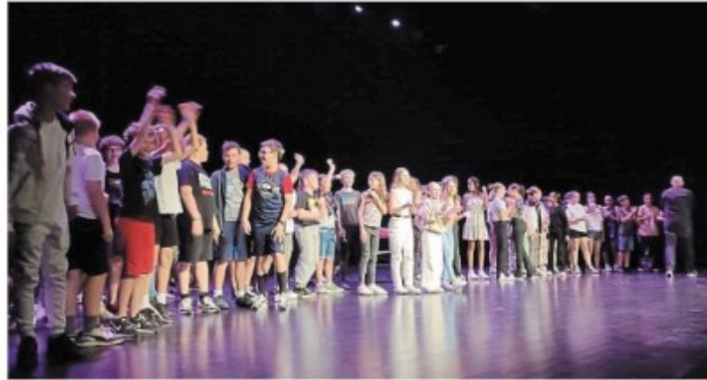
Les élèves de 6 e sont montés sur les planches devant 200 personnes venues les applaudir.