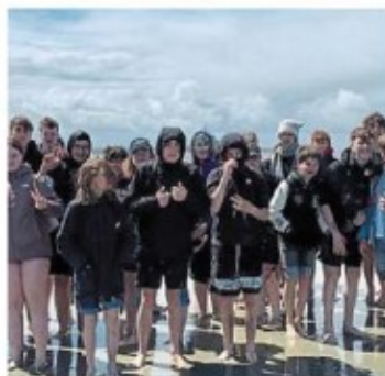
La traversée de la baie.

Un séjour qui fut l'occasion de rencontres avec les familles françaises qui les ont accueillies, mais aussi ponctué de temps d'échanges avec les élèves de l'école Louise-Mi-