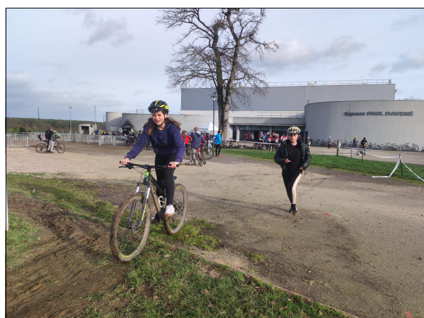
Nos élèves lors de la compétition de Run & Bike