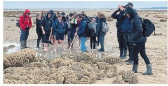
Dans le cadre du projet d'aire marine éducative, les élèves de 5 e 3 option char à voile ont visité le site des Hermelles, à Cherruix.

Dans le cadre de l'étude de la biodiversité de leur aire marine éducative, les élèves de 5 e 3, option char à voile, ont réalisé une randonnée de 13 km, lundi dans la baie du Mont-Saint-Michel.