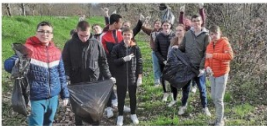
Les collégiens n'ont pas eu besoin de trop s'éloigner de leur collège pour trouver des déchets abandonnés dans la nature.

Le collège Paul-Féval labellisé E3D, est un Établissement en démarche globale de développement durable.